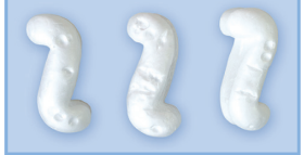
S字状発泡ポリスチレン

形状はS字状であり比較的均一でこれらが互いに絡み合い約50%の空隙を形成します。大きな空隙を作りうることから、優れた透水性を得ることができます。