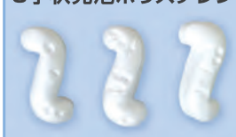
S字状発泡ポリスチレン

形状はS字状であり比較的均一でこれらが互いに絡み合い約50%の空隙を形成します。大きな空隙を作りうることから、優れた透水性を得ることができます。