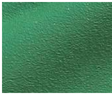
ライトグリーン色